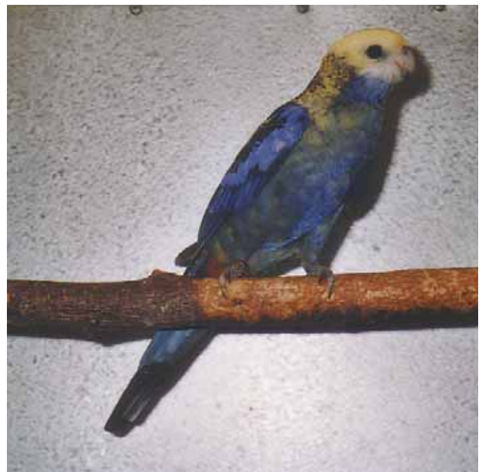
1,0 Blauwangenrosella (Zuchthahn) – Vorderansicht.