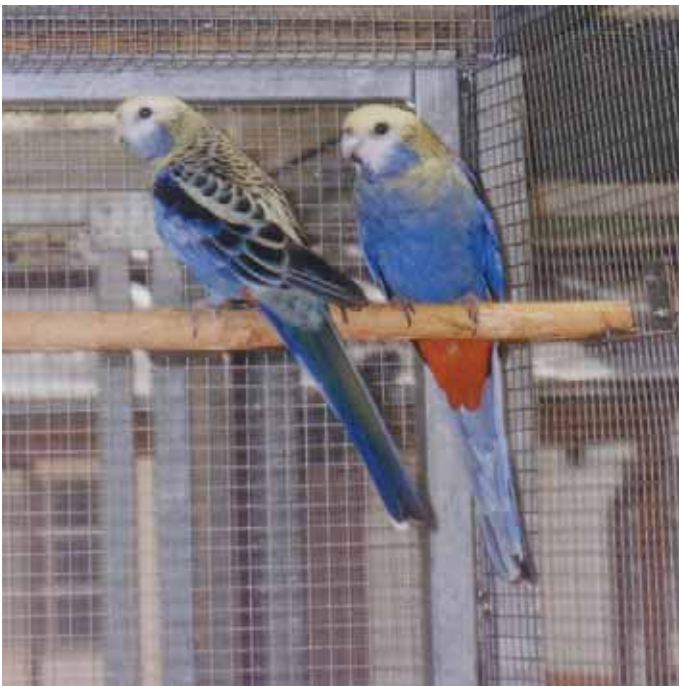
1,1 Blauwangenrosella (Zuchtpaar) – links 0,1, rechts 1,0.