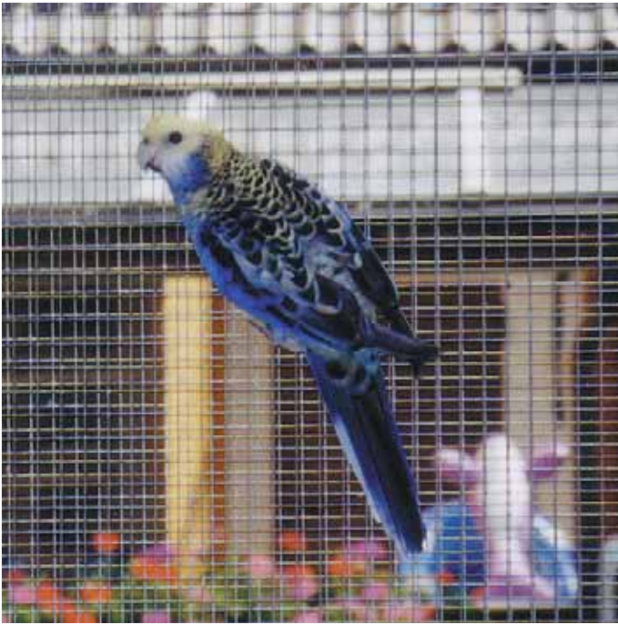
1,0 Blauwangenrosella (Zuchthahn) – Rückenansicht.