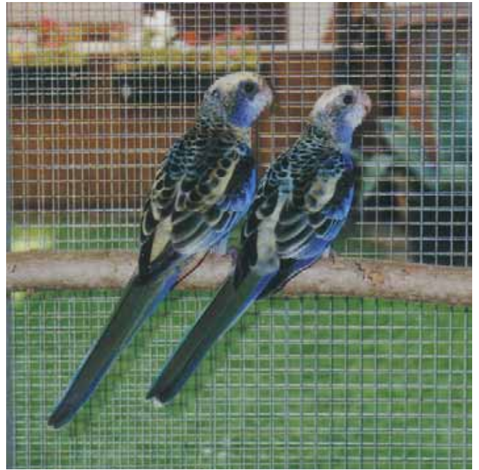
1,1 Blauwangenrosella (Jungtiere) – links 1,0, rechts 0,1.