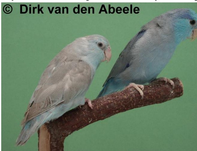
Blaueckersperlingspapageien links 0,1 zimtblau; rechts 1,0 Blau

Als letzter Test wurde im November 2004 ein Hahn der Mutation "X" mit einer völlig fremden wildfarbigen Henne verpaart. Aus einem Gelege von 7 Eiern schlüpften Anfang